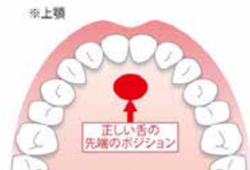
図1 舌のニュートラルポジション 上顎中切歯のすぐ後ろに乳頭切歯という少し膨らんだ部分があります。この周囲で体の正中に舌の先端が自然に触れているのが理想です。