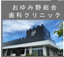
おゆみ野総合 歯科クリニック