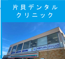
片貝デンタル クリニック