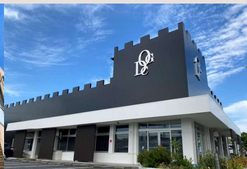
Oyumino General Dental Clinic