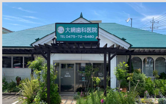
Oami Dental Clinic