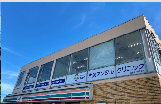
Katakai Dental Clinic